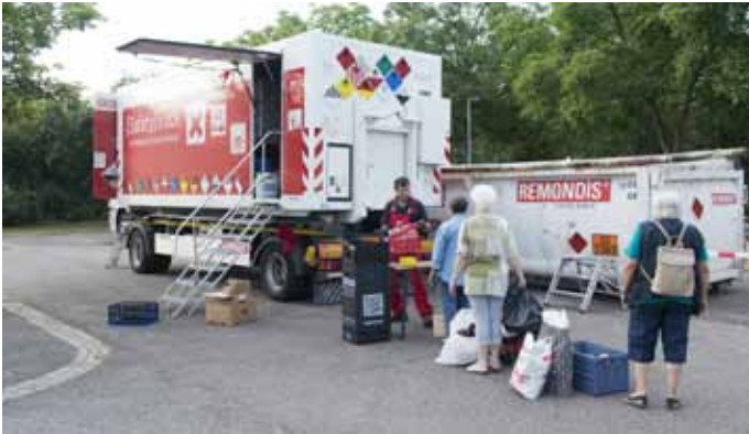
Bei der mobilen Schadstoffsammlung von Mittwoch, 6. März, bis Samstag, 23. März, können alle privaten Haushalte und Kleingewerbebetriebe umweltschädliche Abfälle abgeben.

Alle Fragen zur mobilen Schadstoffsammlung werden über das Servicetelefon des Abfallwirtschaftsbetriebes unter der gebührenfreien Rufnummer 0800 2 98 20 20 beantwortet.