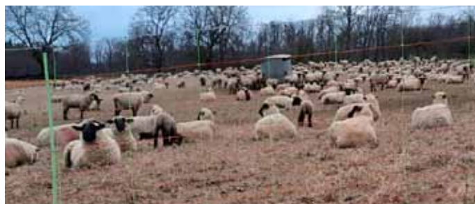
800 Schafe zogen über Kürnbacher Gemarkung

Schafwolle hat einen hohen Stickstoffgehalt von bis zu 12 %, sowie Kalium, Phosphor und Magnesium. Da die Wolle größtenteils aus dem Protein Keratin besteht, führt Sie den Pflanzen Kohlenstoff, Sauerstoff, Wasserstoff und Stickstoff zu. Wenn die Schafwolle abgeschnitten wurde kann Sie bis zum 3,5-fachen des Eigengewichts an Wasser aufnehmen. Dies ist ein besonderer Vorteil in Trockenperioden, da die Feuchtigkeit nach und nach an seine Umgebung abgegeben wird.