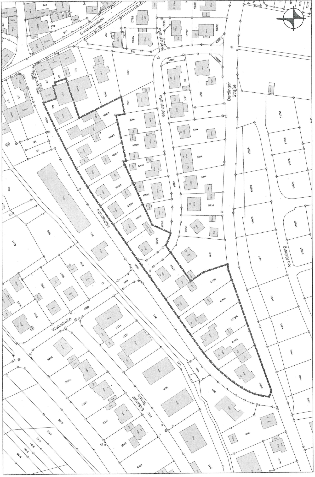
Gemeinde Kürnbach - Bebauungsplan "Mühlstraße" - Übersichtsplan Geltungsbereich, M 1:1.000