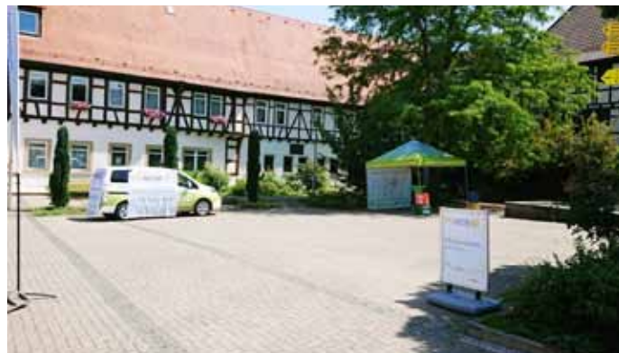
Das PV-Mobil in Kürnbach.

Bürgerberatungsangebot des Landkreises Karlsruhe Telefon Energieberatung: 0721 936-99690 Telefon Photovoltaikberatung: 0721 936 99710 Email-Adresse: buergerberatung@uea-kreiskarlsruhe.de