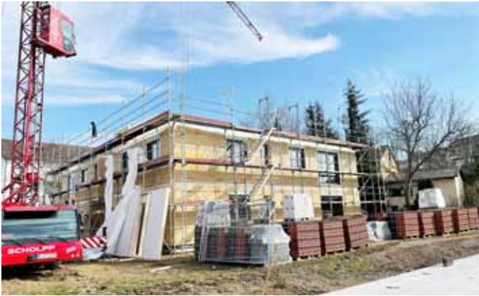
Baustart Sickinger Straße

körper mit jeweils acht Wohnungen. Die Wohnbebauung in der Sickinger Straße wird somit fortgesetzt und es entsteht ein attraktives Angebot an Neubauwohnungen.