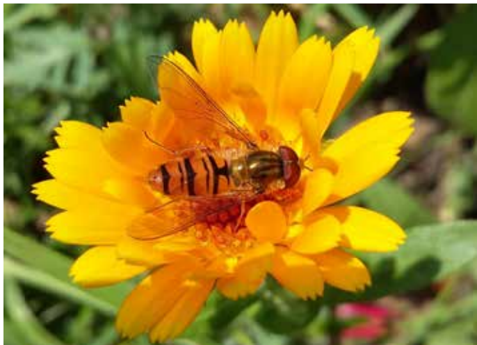
Fotos und Text: Helga Wulf Quellen: NABU, LfL Bayerische Landesanstalt für Landwirtschaft

• _____ Bitte setzen Sie sich direkt mit dem Anbieter unter der Tel.Nr. _____ in Verbindung.