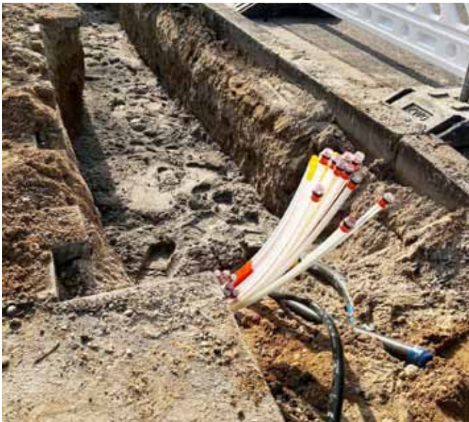
Der Kreistag begrüßte einen kooperativen eigenwirtschaftlichen Ausbau des Glasfasernetzes im Landkreis durch private Telekommunikationsunternehmen.

Die BLK wurde 2014 mit Sitz in Karlsruhe gegründet. Gesellschafter sind der Landkreis Karlsruhe und die TelemaxX Telekommunikation GmbH. Das Unternehmen hat sich zum Ziel gesetzt, eine Versorgung von mindestens 50 Mbit/s in allen Städten und Gemeinden des Landkreises zu erreichen.