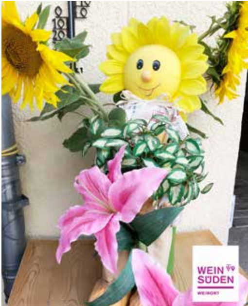
In einem Kürnbacher Garten