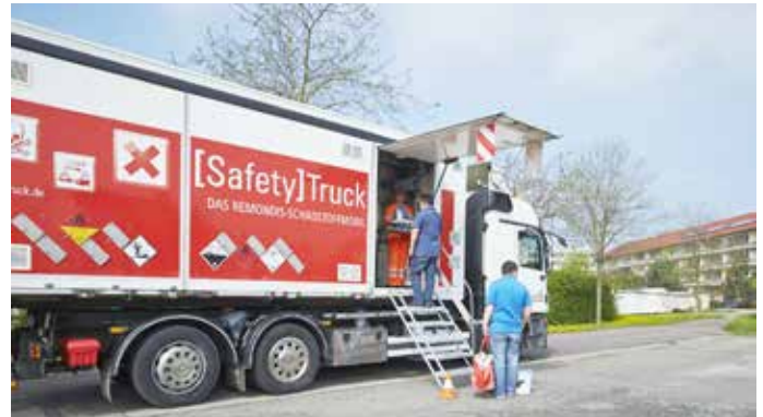
Das Schadstoffmobil kommt von Mittwoch, 29. Juni, bis Samstag, 16. Juli, in alle Städte und Gemeinden im Landkreis Karlsruhe.

Fragen zur mobilen Schadstoffsammlung werden über das Servicetelefon des Abfallwirtschaftsbetriebes unter der gebührenfreien Rufnummer 0800/2 98 20 20 beantwortet.