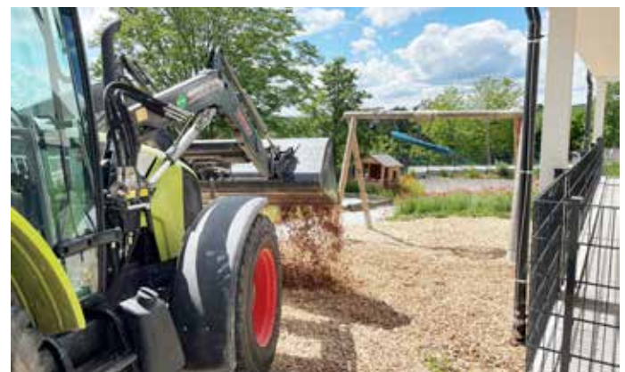
Einbringung von Fallschutz

Durch die Sanierung der Grundschule, den Abbruch der Treppe, wurde der Spielbereich für den Kindergarten mit ca. 700 m 2 verdoppelt. Wir danken den Bauhofmitarbeitern der Gemeinde welche hier sehr kurzfristig reagiert haben. In diesem Zuge mussten leider andere Arbeiten zurückgestellt werden und wir bitten den Verzug zu entschuldigen. Insbesondere die Mäharbeiten werden aktuell sukzessive nachgeholt.