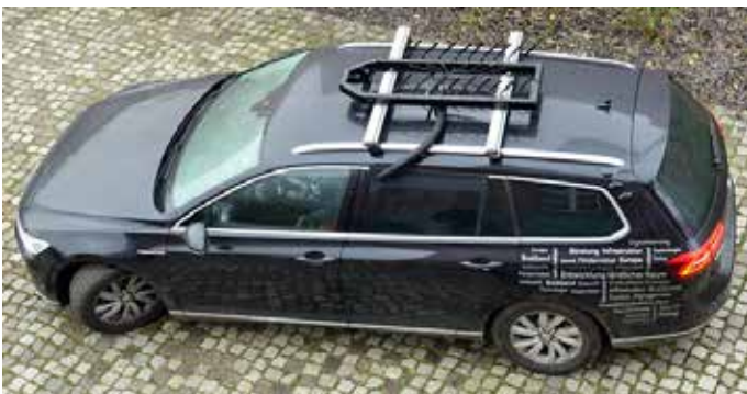
Messfahrzeuge sollen Daten sammeln und einen Überblick schaffen: Der Landkreis Karlsruhe will gemeinsam mit der BLK die Mobilfunkversorgung verbessern.

Der Landkreis Karlsruhe unternimmt bereits seit Jahren Anstrengungen, die modernen Kommunikationswege für die Einwohnerinnen und Einwohner optimal nutzbar zu machen. Dazu zählt neben einem leistungsfähigen Mobilfunknetz auch die Anbindung an schnelles, funktionstüchtiges Internet. Mit der BLK erschließt der Landkreis nach und nach Flächen wie Wohn- und Gewerbegebiete durch Glasfaserausbau – besonders dort, wo Privatunternehmen keinen Mehrwert sehen und somit keine Infrastruktur schaffen.