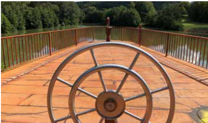
Bühne für das kleine Konzert