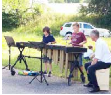
Marimbaphon (Klasse U. Dürr)