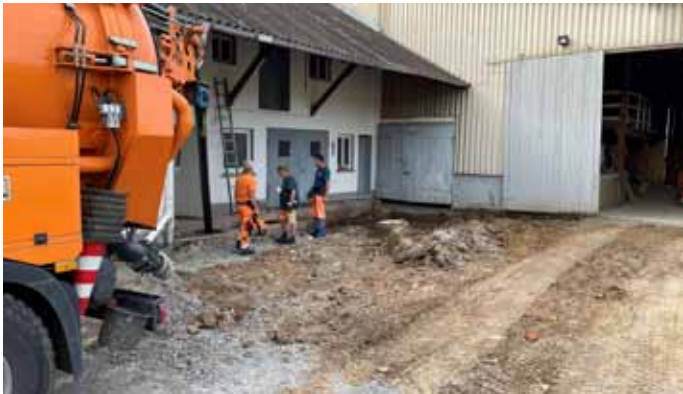
Vorbereitung Gelände für Waschplatz

Am Standort des neuen Bauhofs am Badweg gehen die Arbeiten voran. Zunächst wurden die Lagerräumlichkeiten entsprechend strukturiert und ausgestattet. Im Hof wird aktuell ein Waschplatz für die Fahrzeuge errichtet. In diesem Zuge musste auch eine Grube geleert und ein Teilstück der Kanalisation erneuert werden. Am 19. Juli ist eine entsprechende Begehung des Areals mit dem Technischen Ausschuss des Gemeinderats vorgesehen.