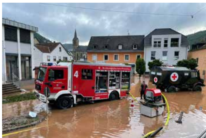
Ein Einsatzfahrzeug des Hochwasserzugs Karlsruhe Land im Einsatz in der Gemeinde Kordel/Rheinland-Pfalz.

Vier Krankentransportwagen haben am Donnerstagabend den Sammelpunkt bei der Landesfeuerwehrschule Baden-Württemberg in Richtung Rheinland-Pfalz verlassen. Parallel dazu wurde der „Zug Hochwasser Karlsruhe Land“ des Katastrophenschutzes des Landkreises Karlsruhe, bestehend aus einem Kommandowagen, einem Löschgruppenfahrzeug Katastrophenschutz, einem Rüstwagen mit Boot, einem Gerätewagen-Transport sowie einem Mannschaftstransportwagen entsandt. Er verließ um 21.15 Uhr den Sammelpunkt in Bad Schönborn in Richtung Rheinland-Pfalz. Acht Einsatzkräfte des Fachdienstes Sanität und Betreuung, gestellt durch die Hilfsorganisationen DRK Kreisverband Karlsruhe und ASB Region Karlsruhe sowie 18 Einsatzkräfte von Freiwilligen Feuerwehren aus dem Landkreis Karlsruhe sind im Einsatz. Zwischen Anforderung durch das Innenministerium und Ausrücken vergingen gerade einmal zwei Stunden. Die Kräfte gehen von einer Mindesteinsatzdauer von zwei Tagen aus.