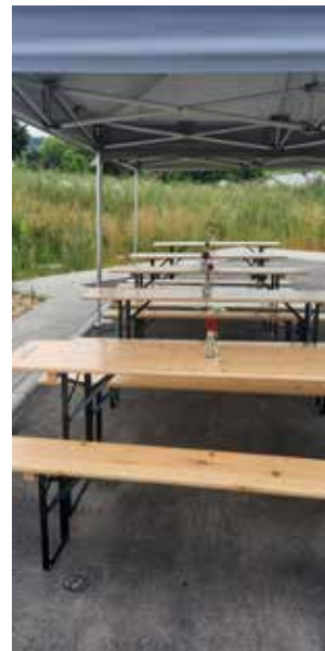
Neue Festzeltgarnituren der Gemeinde

Zur Einweihung des Baugebietes Alsberg konnten auch die neuen Festzeltgarnituren der Gemeinde eingeweiht werden.