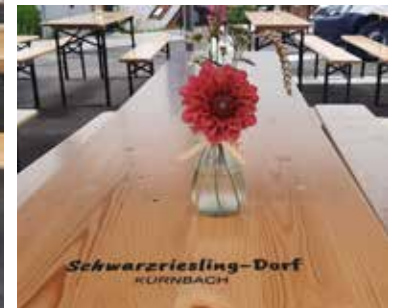
Aufdruck auf den Tischen.

Die Tische sind mit dem Aufdruck „Schwarzriesling-Dorf Kürnbach“ versehen. Für die Bänke wurden zusätzlich passende Sitzauflagen bestellt. Die Tische haben die passenden Tischdecken erhalten.