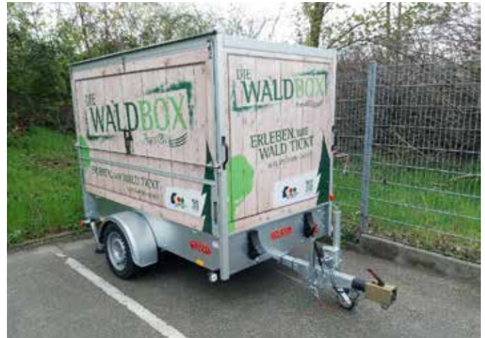
Waldbox Landratsamt Karlsruhe mit vielfältigen Materialien zur Waldpädagogik

Das Jahresprogramm Waldpädagogik Karlsruhe und weitere Informationen sind unter https://www.waldpaedagogik-karlsruhe.de/ zu finden.