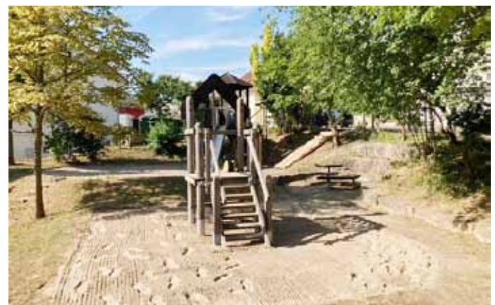
Spielplatz Eichenstraße Spielgerät