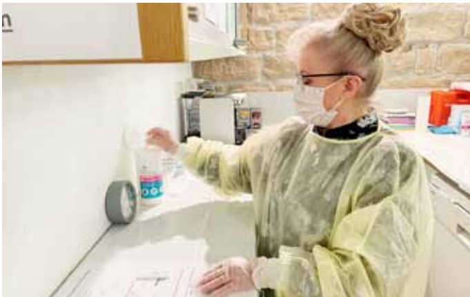
Teststation im Weinhaus