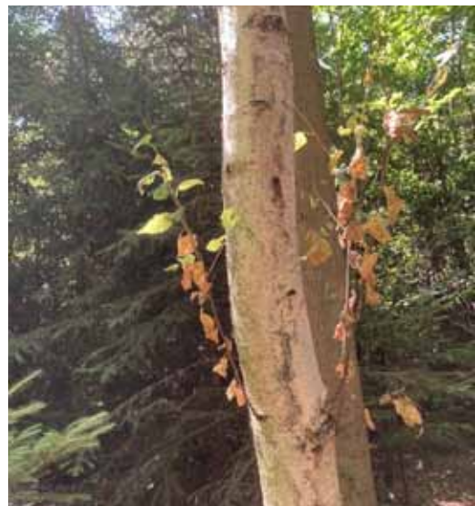
Birke mit deutlichen Anzeichen des Notabwurfs durch Hitzestress

Schlimmer als die andauernde Hitze ist dabei der ausbleibende Regen. Schon durch die heißen Sommer der vergangenen Jahre sind die Wasserreserven im Boden nahezu aufgebraucht. Insbesondere in den für die Bäume so wichtigen Bodenschichten bis in zwei Meter Tiefe herrscht akuter Wassermangel, nach Angaben des Dürremonitors sogar eine extreme Dürre.