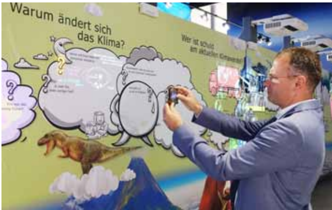
Klima Arena Sinsheim

Da nun der Förderzeitraum zum 31.12.2022 endet, haben sich die Landräte und Bürgermeister der LEADER Kulisse Kraichgau, zur Vorstellung des Entwicklungskonzeptes für eine erneute Bewerbung in Sinsheim getroffen. Wenn wir Glück haben, wird der Antrag vom Ministerium für Ernährung, Ländlicher Raum und Verbraucherschutz befürwortet und es gibt eine weitere Fördermöglichkeit bis 2027. Mit Blick auf den Klimawandel wurde die KLIMA ARENA bewusst für die Präsentation des Konzeptes ausgesucht. Bei dieser Gelegenheit hat sich BM Armin Ebhart über die Auswirkungen auf die unterschiedlichsten Lebensbereiche informiert und ein Besuch kann empfohlen werden ( www.klima-arena.de ).