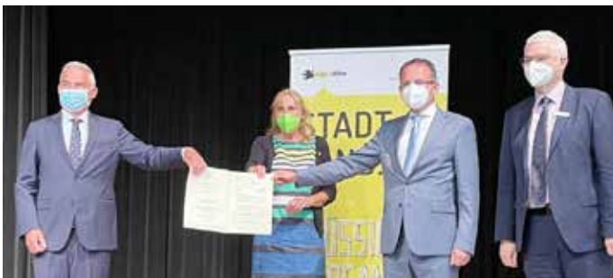
v. l. Minister Strobl, MdL Schwarz, BM Ehart, Dezerent Watteroth(LKR Karlsruhe)

Am 26. August 2021 überreichte Innenminister Thomas Strobl einen Förderbescheid in Höhe von 52.480 € an Bürgermeister Armin Ehart für den Glasfaserausbau in den Heiligenäckern. Da Kürnbach für den Glasfaserausbau in der Vergangenheit bereits berücksichtigt wurde, ist die Förderung nicht selbstverständlich. Im Zuge der Erneuerung der Löschwasserversorgung sowie der Wasserleitungen kann nun auch dieser Außenbereich mit schnellem Internet versorgt werden. In der Gemeinde Illingen im Enzkreis erhielten zahlreiche Kommunen aus Baden-Württemberg entsprechende Förderbescheide. Zielsetzung der Regierung ist es, alle Haushalte mit schnellem Internet zu versorgen, so der Minister. Im Landkreis Karlsruhe bewerkstelligt die BLK GmbH den zügigen Ausbau. www.breitbandkabel-karlsruhe.de