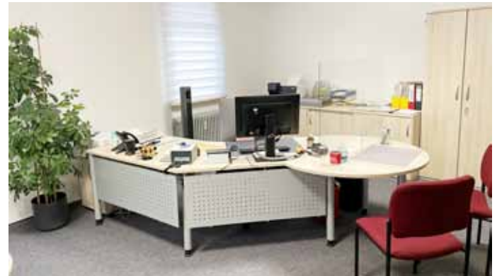
Bürgerbüro (Pass- und Meldewesen)