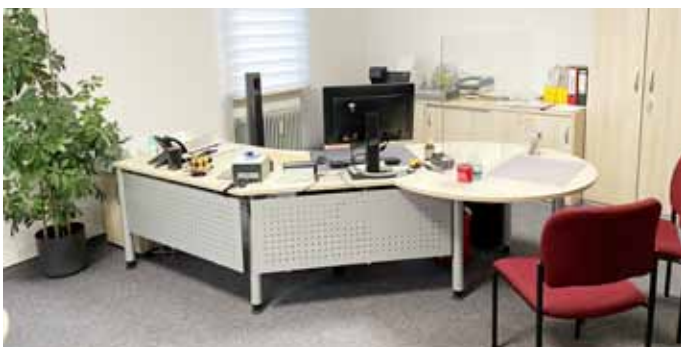
Bürgerbüro (Pass- und Meldewesen)

Montag: 08:00 - 12:00 Uhr Dienstag: 08:00 - 12:00 Uhr und 14:00 - 18:30 Uhr Mittwoch: geschlossen Donnerstag: 08:00 - 12:00 Uhr Freitag: 08:00 - 12:00 Uhr