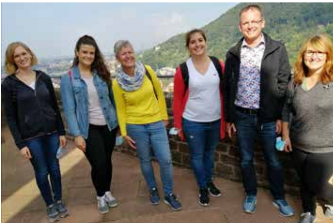
Teambild während der Schlossführung

Am 17.09.2021 hatte die Gemeindeverwaltung erstmals einen Betriebsausflug nach Heidelberg unternommen. Die Wahl des Ziels war mit der Auflage eines Bildungsmehrwertes verbunden. Corona-Auflagen, Tourismus und Geschichte neben Kaiserwetter und Spaß war angesagt. Vom Hauptbahnhof in Eppingen ging es mit der S5 nach Heidelberg. Im Heidelberger Schloss