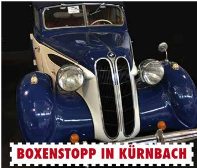
Oldtimer fahren durch Kürnbach

Im Rahmen der Rotary-Charity-Classics kommen am Samstag, den 25.09.2021 von ca. 11.00 bis 12.00 Uhr eine Vielzahl an Oldtimern erstmals durch unseren historischen Ortskern. Auf der gesamten Tour ist nur in Kürnbach ein exklusiver Boxenstopp für Fotos vorgesehen. Die wunderschönen Fachwerkhäuser bieten hier eine tolle Kulisse. Die Bevölkerung und alle Automobilfreunde sind recht herzlich zu diesem kurzweiligen Event eingeladen. Für Kaffee und Kuchen sorgt der in Kürnbach bereits bekannte Food Truck. Bitte beachten Sie, dass ein Parken direkt an der Kronenstraße nicht möglich ist. Die ausgewiesenen Parkplätze stehen selbstverständlich zur Verfügung.