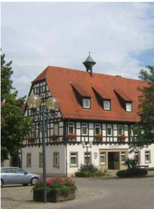
Wahllokal Rathaus / Bürgerbüro Wahlbezirk 01 – Altort