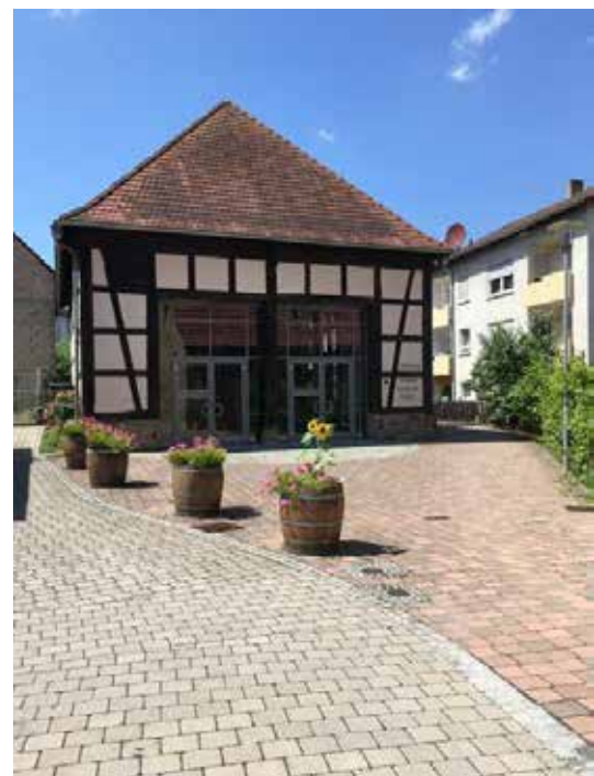
Wahllokal Badische Kelter Wahlbezirk 02 - Neubaugebiete