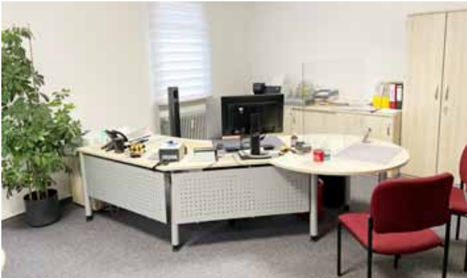
Bürgerbüro (Pass- und Meldewesen)