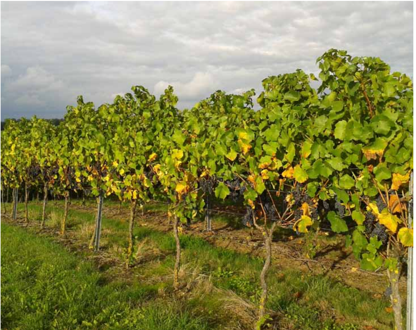
Die Weinlese hat begonnen