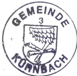
Armin Ebhart Bürgermeister