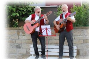
Bänkelsänger „Wein, Sang & Gang“